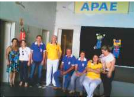
Visita Oficial no LC de Nhandeara - APAE 10/10/2014