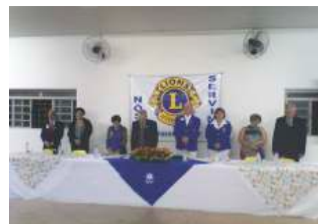
LC de Mirassol - 20/09/2014