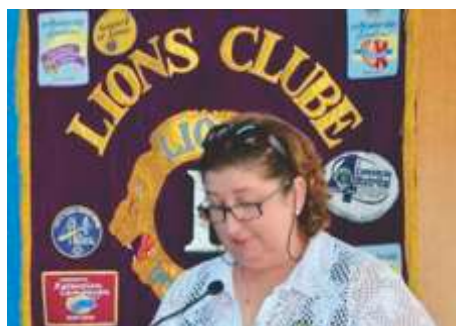
Reunião Administrativa Regiões C, D e E - Sertãozinho