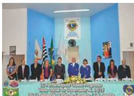
Visita Oficial LC Fernandópolis Cidade Progresso - 24/09/2014