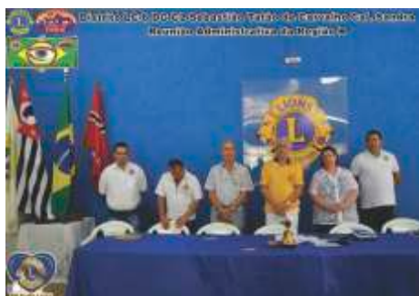
Reunião Adiministrativa - Região B LC São José do Rio Preto - Sul