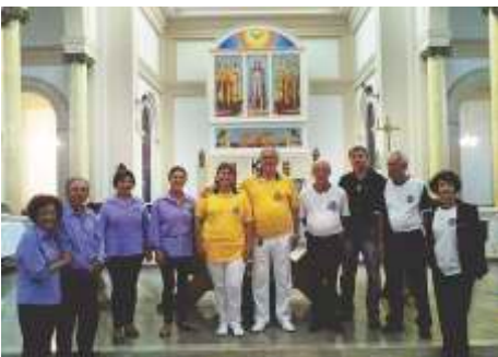
Visita na Igreja Matriz Bom Jesus da Cana Verde - Batatais