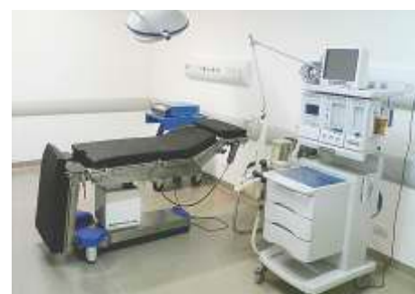
Hospital Pio XII, de Prevenção do Câncer LC Fernandópolis - Centro