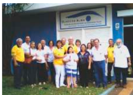
Visita na entidade Olhos da Alma LC Jaboticabal