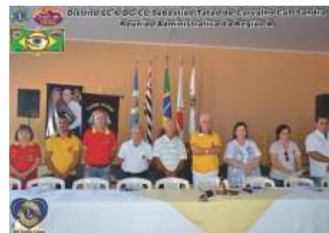
Reunião Administrativa Região A LC Votuporanga - Centro