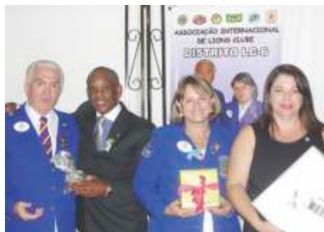
LC - Matão - 14/11/2014