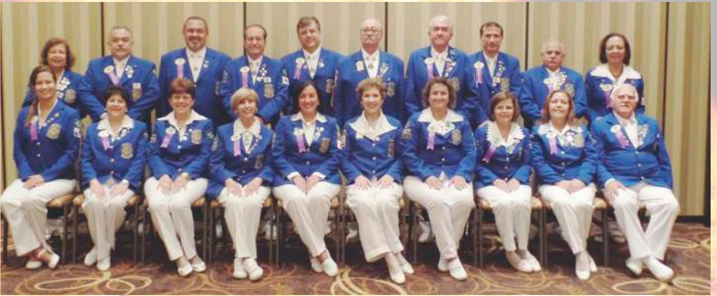
Colegiado "Mãos Dadas"