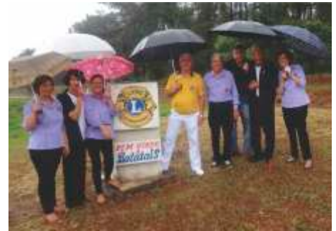
Visita Oficial no LC de Batatais Levamos chuva - 25/10/2014