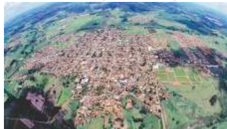
VISTA AÉREA DE POTIRENDABA

A economia sustenta-se na produção canavieira e de cítrico e na pecuária leiteira. Até há pouco tempo, milhares de hectares da zona rural estavam arrendados para o cultivo de cana-de-açúcar, lavoura geradora de expressiva renda local. Porém, com o apoio do Poder Público, os pequenos produtores passaram a se interessar pela produção leiteira e fabricação e comercialização de produtos artesanais. Vem de Potirendaba, por exemplo, a receita do pãozinho de coalhada, criada por uma agricultora da área leiteira. Novos Rumos, em sentido amplo, é o epíteto usado pela localidade.