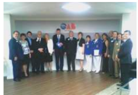
Visita da Governadoria na OAB-SP - Parcerias