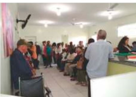
Hospital de Olhos Lions de Taquaritinga Promove mutirão 572 Cirurgias no fim de semana