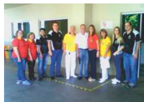
LLCC Votuporanga e Votuporanga Brisas Suaves - 08/10/2014