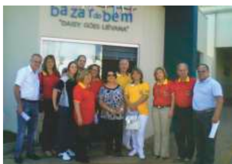
Bazar do Bem em pról da Santa Casa LLCC Votuporanga e Brisas Suaves