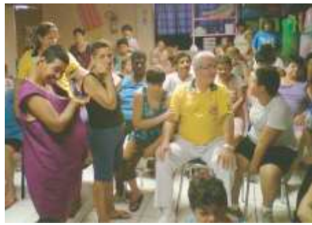
Visita na APRO LC de Nhandeara