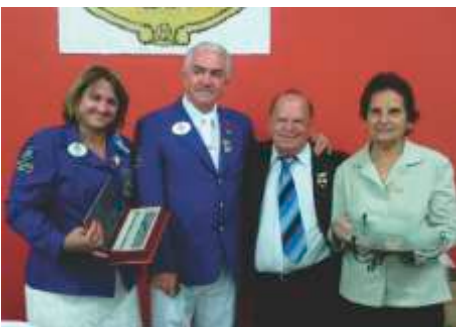
LC Altinópolis - 08/11/2014