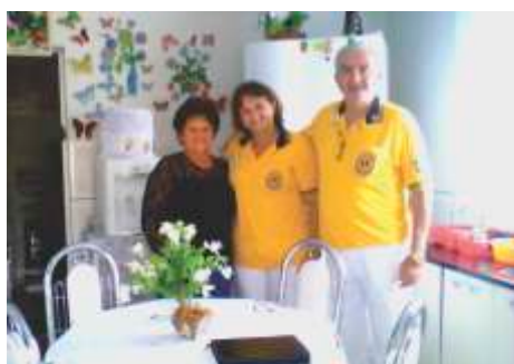
Visita Vila Vicentina, Mirassol