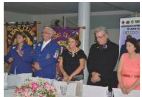
LC Ribeirão Preto - Campos Elíseos 07/11/2014