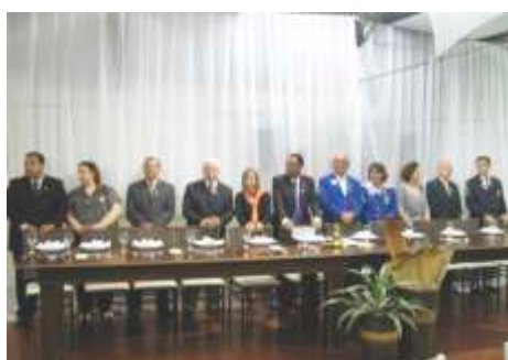
Visita Oficial LC Jaboticabal - 26/09/2014