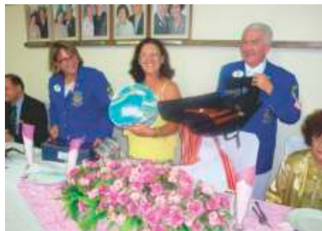
Lions Clube Batatais - 25/10/2014