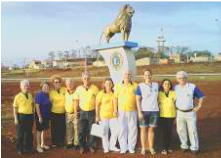
Visita Oficial LLCC de Sertãozinho e Sertãozinho Centenário - 21/10/2014