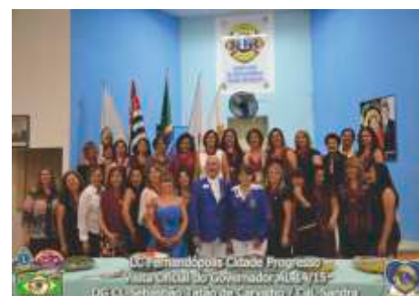
Visita Oficial LC Fernandópolis Cidade Progresso