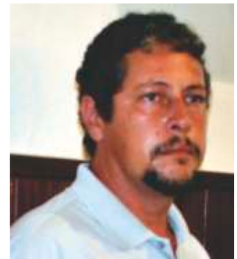
CL CÉSAR GULLO LC BRODOWSKI-SP 01/04/2014

E aquele que não supera esses conflitos, que nos preâmbulos de suas ações há interesses pessoais, não é um verdadeiro leão. Trata-se de uma hiena, que vive à sombra, e sorrateiramente espera os leões agirem para depois saciarem seus anseios.