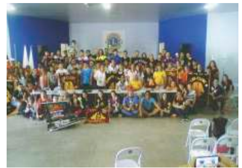
Olimpidas Distrito Leo Nhandeara