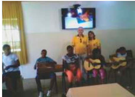
Visita na Adolecentro LC de Monte Azul Paulista - 24/10/2014