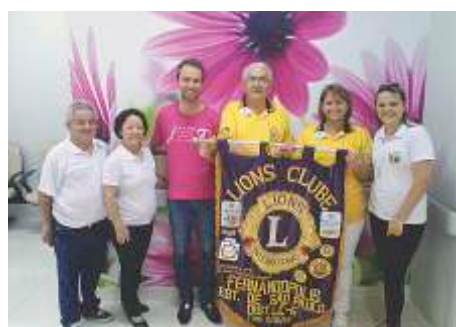
LC Fernandópolis - Centro Hospital do Câncer Pio XII - 09/10/2014